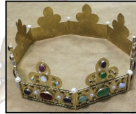
Couronne royale XIIIe siècle

Les mots-clés de mes démonstrations : transformation de la matière