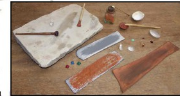
Quelques outils de la taille des pierres précieuses