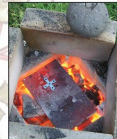
Les émaux révèlent leurs couleurs au feu de la forge