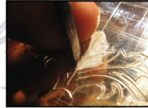
Ciselure et gravure