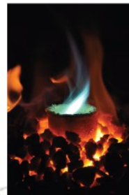
Cémentation du laiton