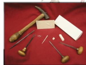
Les outils du travail de l'ivoire