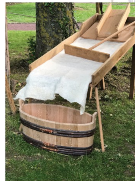
La rampe de lavage