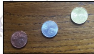
Art de transformer une pièce de cuivre en "argent", puis en "or"

Si mon statut est professionnel, mon animation met en scène un maître orfèvre au ton humoristique et dont le propos précis mais sans prétention, met le public dans le secret des techniques anciennes en s'adaptant à son âge et à ses questions.