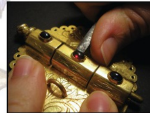
Sertiage de pierres fines et précieuses