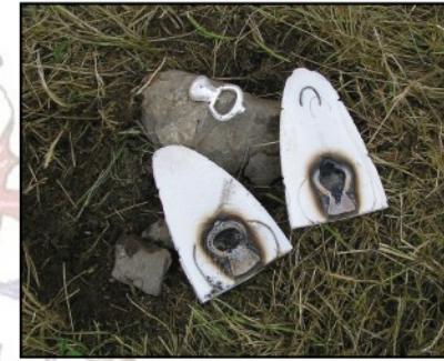
Foyle d'argent et d'or fin à l'os de seiche