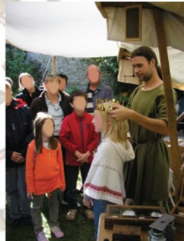
Maître Etienne coiffant une jeune demoiselle d'une couronne comtale du XIIIe siècle

Si mon statut est professionnel, mon animation met en scène un maître orfèvre au ton humoristique et dont le propos précis mais sans prétention, met le public dans le secret des techniques anciennes en s'adaptant à son âge et à ses questions.