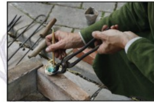
La fabrication des fausses pierres précieuses en cristal de roche et verre coloré

Je présente l'histoire et les techniques de mon artisanat sur les fêtes médiévales, dans la presse spécialisée, en milieu scolaire, archéologique et universitaire. Fort de plusieurs années de recherches et de pratique, je ne cesse d'approfondir mon sujet, ce qui me permet d'enrichir chaque année mon animation.