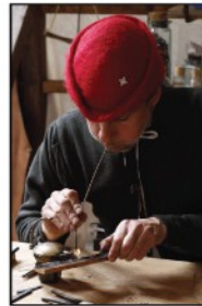
Soudure au chalumeau à bouche

Les mots-clés de mes démonstrations : transformation de la matière