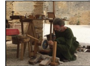
Les gemmes changent de forme et révèlent leur éclat grâce à la dextérité du lapidaire, travaillant sur son tour à archet